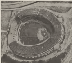
Esaki ta un bista aerea cual ta mustra e estadio municipal di Cleveland, na unda e di 34 wega di Estrellanan Beisbalera lo wordo efectua.